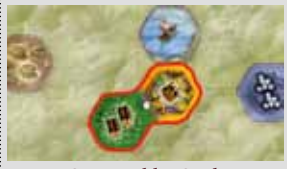
Seite Wald + Stadt

Bevor die neuen Doppelpättchen mit den anderen Doppelpättchen zusammengemischt werden, entferne ihr je nach Spielerzahl eine bestimmte Anzahl ungesehen aus dem Spiel: bei 4 Spielern 16 (statt 4), bei 3 Spielern 20 (statt 8) und bei 2 Spielern 24 (statt 12). Erst danach mischt ihr die neuen Doppelpättchen mit den verbliebenen Doppelpättchen zusammen und bildet einen verdeckten Stapel.