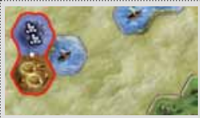
Seite Gebirge + Hügel

Wähle zufällig eine der beiden Seiten des neuen, doppel-seitigen Startplättchens und platziere es entsprechend auf dem Spielplan. Diese Landschaften werden wie die anderen aufgedruckten Landschaftsfelder später angeschlossen. Es wird kein Plättchen bei Spielbeginn direkt dort angelegt!