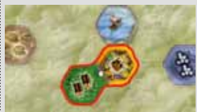
Bos- en stadzijde

Kies willekeurig een zijde van de nieuwe starttegel en plaats deze op het bord op de aangegeven positie.