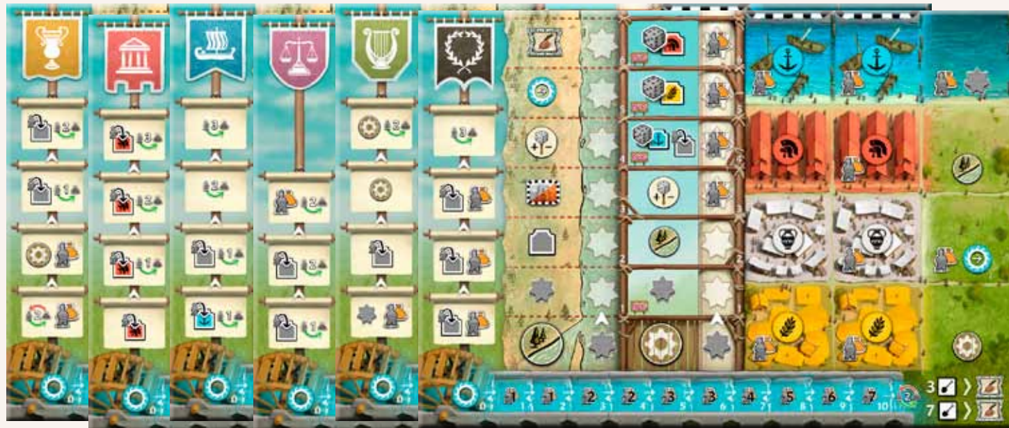
De nieuwe individuele Stadsborden zijn te herkennen aan de gekleurde banieren (linksboven).