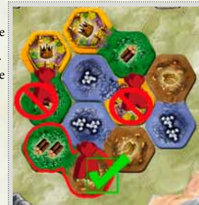
Plaats figuren correct

Opmerking: Je mag er ook voor kiezen om geen van deze beide acties te doen.