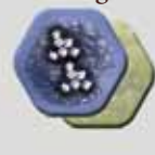
8 kastelen (2 elk in 4 kleuren)