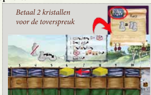
Betaal 2 kristallen voor de toverspreuk

6.3.1. Als je een kaart uit je hand speelt als toverspreuk betaal je de op de kaart afgebeelde kosten in kristallen en verplaats je je kristalmarker overeenkomstig.