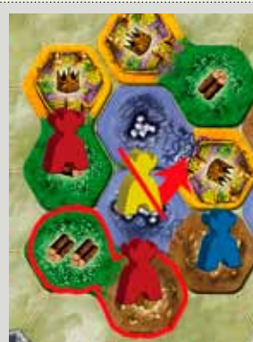
Omsluit een gebied + verwijder figuren

Je mag geen andere tegels, kastelen of meren afdekken, noch mag je een tegel over de rand van het speelveld plaatsen.