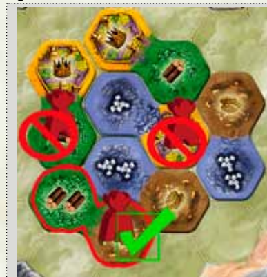
Pion correctement placé

ou Vous pouvez reprendre un de vos pions du plateau et le mettre dans votre réserve.