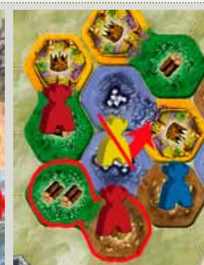
Région clôturée + écarter des pions