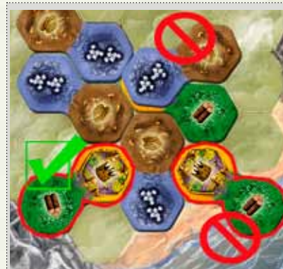
Tuile placée correctement

Les pions se trouvant sur des régions complètement clôturées retournent immédiatement dans la réserve des joueurs concernés (voir 7.1. Clôturer une région). Exception : château et bateau. Dans ce cas, les pions restent sur le plateau après que le château ou le bateau aient été clôturés.